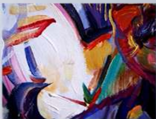
ลิขสิทธิ์