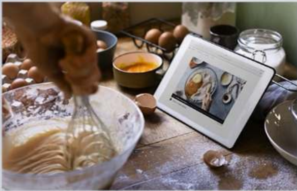
ความลับทางการค้า