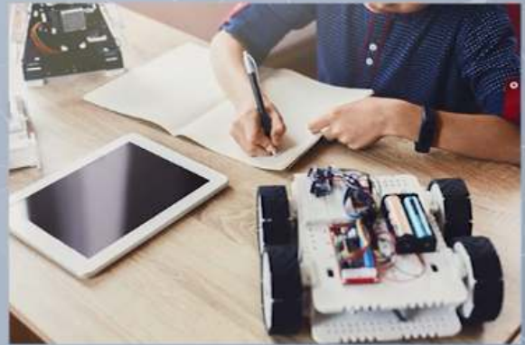
สิทธิบัตร